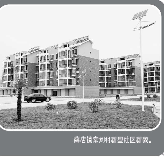
薛店镇常刘村新型社区新貌。

6月17日上午,中国共产党新郑市第四次代表大会在炎黄文化中心隆重召开,大会受到了社会各界群众的广泛关注。图为新郑街道办事处车站社区居委会的群众在收看市四次党代会实况。