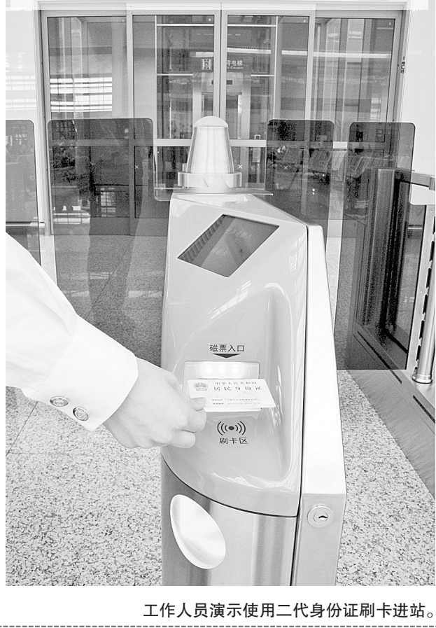
工作人员演示使用二代身份证刷卡进站。

记者23日从铁道部获悉,京沪高速铁路定于6月30日15时正式开通运营。 从6月24日9时起,铁路部门开始对外发售京沪高铁车票。旅客可通过中国铁路客户服务中心网站(www.12306.cn)、车站售票厅、车票代售点等多种途径购买京沪高铁车票。