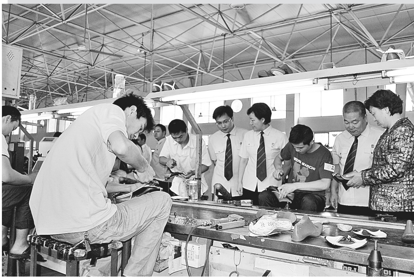
法官走访辖区企业,了解需求,为企业发展提供法律援助。

供法律帮助上办实事,在指导群众通过法律途径解决纠纷上下工夫,始终坚持把转变法院工作作风贯穿活动始终,把解决实际问题贯穿始终。全院党员法官定点联系一到两个社区(乡村),坚持到社区提供法律服务,主持调解矛盾纠纷。与电视台、报纸等新闻媒体合作,在乡镇、企业、学校等地开展法律咨询、编发法律知识手册等活动,提高大家的守法意识,为辖区经济发展和社会稳定提供法律帮助。管城法院还根据城市特点及辖区的区域特点设立了物业纠纷社会法庭、物流社会法庭、少数民族社会法庭,对于解决新形势下的城市社会矛盾化解进行了有益探索,取得了较好效果。该院设立的物业社会法庭被省高级人民法院院长张立勇称为“新时期城市社会矛盾的有益探索”。该院少年庭试行的少年刑事案件社会调查员制度,