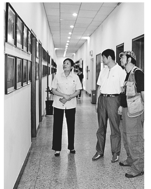
6月10日~23日,管城区人民法院举办第三届书画、摄影作品展,共展出书画、摄影作品120余幅。该院干警用笔墨书写廉政法制,用镜头记录祖国大好河山。

突破传统量刑模式,积极推进量刑规范化改革。作为全省量刑规范化试点单位,金水区法院少年庭进一步规范了从重、从轻、减轻等处罚情节幅度,真正实现了未成年人刑事审判工作的科学发展。