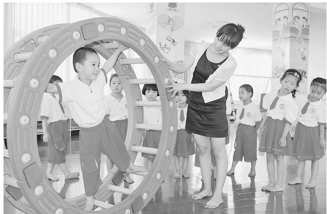
作为登封唯一一家开展感统课程、沙盘游戏的特色幼儿园,白坪新区幼儿园坚持每周一节感统课和沙盘游戏课,受到家长和学生的的好评。图为6月26日下午,登封白坪新区幼儿园在上感统课。

据了解,为迎接建党90周年,引导全市广大党员立足本职岗位,发挥先锋模范作用,近日,登封市委组织部以在全市范围内分行业、分系统开展“党员技能展示”活动,其中农村党员以“才艺能力”展示为主,包括带富能力、书画摄影、文艺节目和工艺制作等,企业党员以“生产技能”展示为主,包括在企业生产流程中的专业技术和岗位技能等,机关党员以“优质服务”展示为主,包括立足本职岗位,围绕服务基层、服务群众,得到群众公认的具体服务技能。截至目前,已有4000余名工作在各行各业一线的共产党员竞相登台,展示才艺、展现技能。