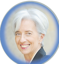
克里斯蒂娜·拉加德