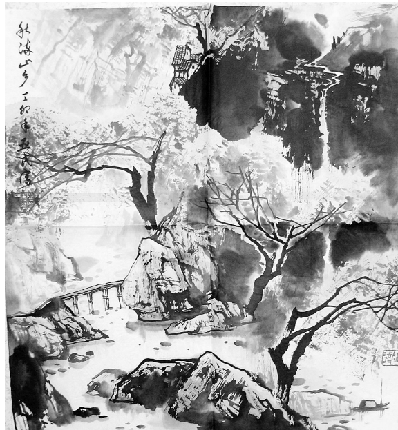
秋海山乡(国画) 亚民