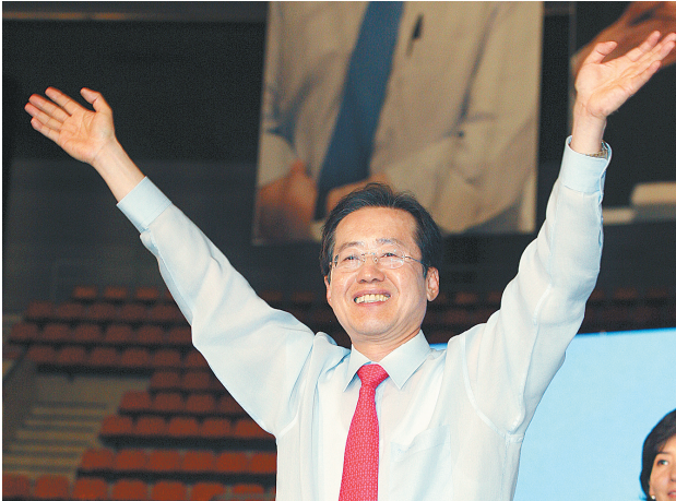
7月4日,在韩国首尔,洪准杓当选韩国大国家党党代表后挥手致意。

据新华社首尔7月4日电 韩国执政党大国家党4日举行新一届党代表和最高委员选举,洪准杓当选新任党代表。任期至明年7月13日止。 洪准杓在当选后说,大国家党当前首要的改革任务就是打破派系,团结一致应对明年举行的国会议员选举和总统选举。 韩国舆论认为,洪准杓获胜得益于他树立的“亲民”和“改革”的良好形象。