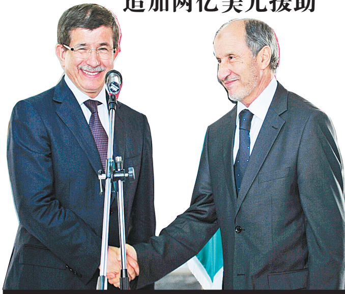
7月3日,在利比亚东部城市班加西,土耳其外交部长艾哈迈德·达武特奥卢(左)与利比亚反对派“全国过渡委员会”主席穆斯塔法·阿卜杜勒-贾利勒在新闻发布会上握手。

据新华社利比亚班加西7月3日电 土耳其外长达武特奥卢3日在班加西宣布,土耳其正式承认“全国过渡委员会”为利比亚人民的合法代表。达武特奥卢说,土耳其将向利比亚反对派提供两亿美元援助,现在到了利比亚领导人穆阿迈尔·卡扎菲离开的时候。 达武特奥卢当天到访利比亚反对派大本营班加西,与“全国过渡委员会”主席穆斯塔法·阿卜杜勒-贾利勒等反对派主要官员进行了会谈。 达武特奥卢在会谈后举行的记者招待会上表示,除了此前已经承诺的1亿美元经济援助,土耳其还将向利比亚反对派追加2亿美元的援助,主要用于班加西机场等基础设施的战后重建。 土耳其外长说,他希望这场危机能在本月初,即穆斯林斋月开始前结束。 法国、意大利、卡塔尔、西班牙、阿拉伯联合酋长国、德国等20多个国家已给予“全国过渡委员会”外交承认。土耳其是北约中唯一的伊斯兰国家,曾明确拒绝参与北约对利比亚的空袭行动。在利比亚武装冲突爆发前,同为地中海周边国家的土耳其与利比亚保持着十分密切的经济关系。