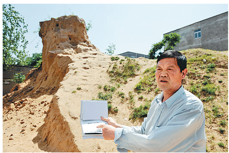
机枪眼儿清晰可见的白沙阻击战遗址。

60余年风雨沧桑,现在韩庄和古城两个村子几乎连到了一起,原来位于俩村之间的塔岗周围已经盖满了楼房。夹在几座院落中间的光秃秃的塔岗上,几处隐约可见的机枪口也已经被风沙抹去了痕迹。 曾经枪林弹雨的地方,如今一片祥和。