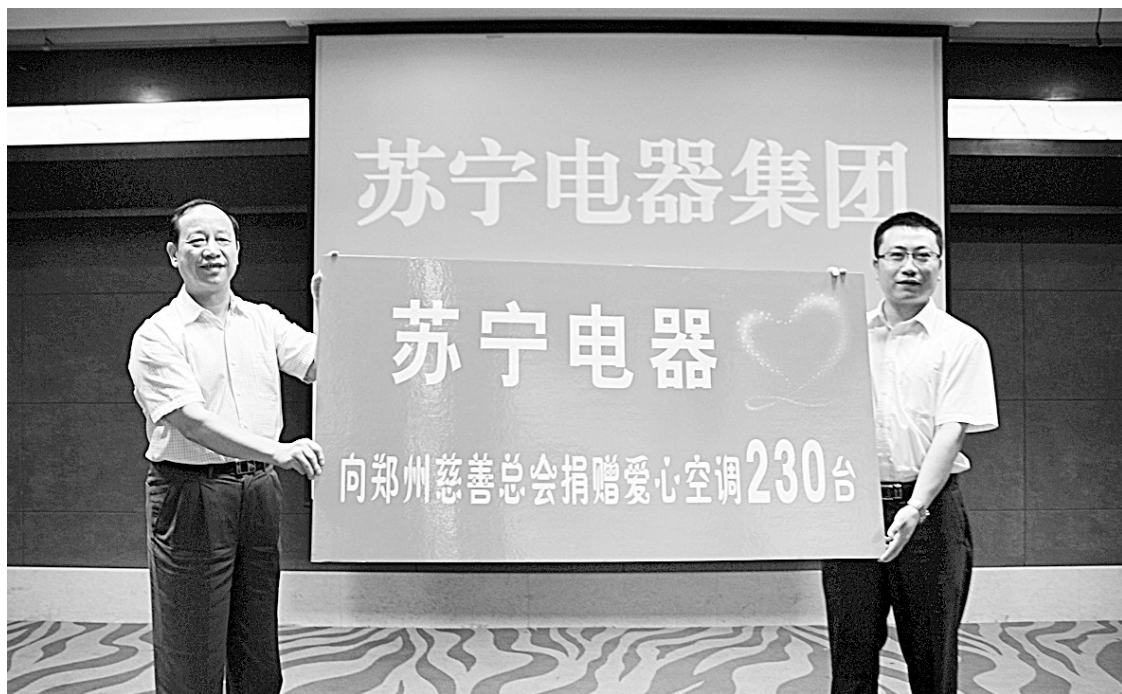
▲苏宁电器向郑州慈善总会捐赠230台空调

对于此次苏宁向郑州地区捐赠230台空调的事迹,郑州慈善总会会长武国瑞表示,苏宁的义举,充分体现了其高度的社会责任感,在推进和谐社会建设和公益事业发展的过程中,需要更多像苏宁这样的企业。