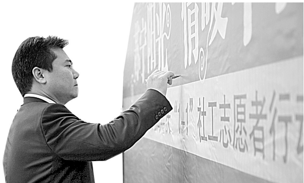
▲苏宁电器董事长张近东履行“1+1阳光行”承诺