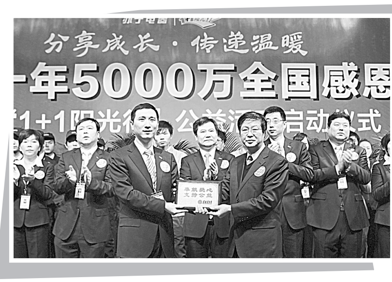
▲2010年12月26日苏宁电器5000万元感恩回馈社会

伴随着社会经济的发展,环境问题愈发严重。苏宁电器在环境保护方面也展开积极行动。2004年,向“保护母亲河”行动捐赠50万元人民币,用于水资源保护工作。2011年,在北京、郑州等地苏宁连续多年开展植树活动的基础上,苏宁在全国各地十多个城市同步开展植树活动,以实际行动投身环保事业。