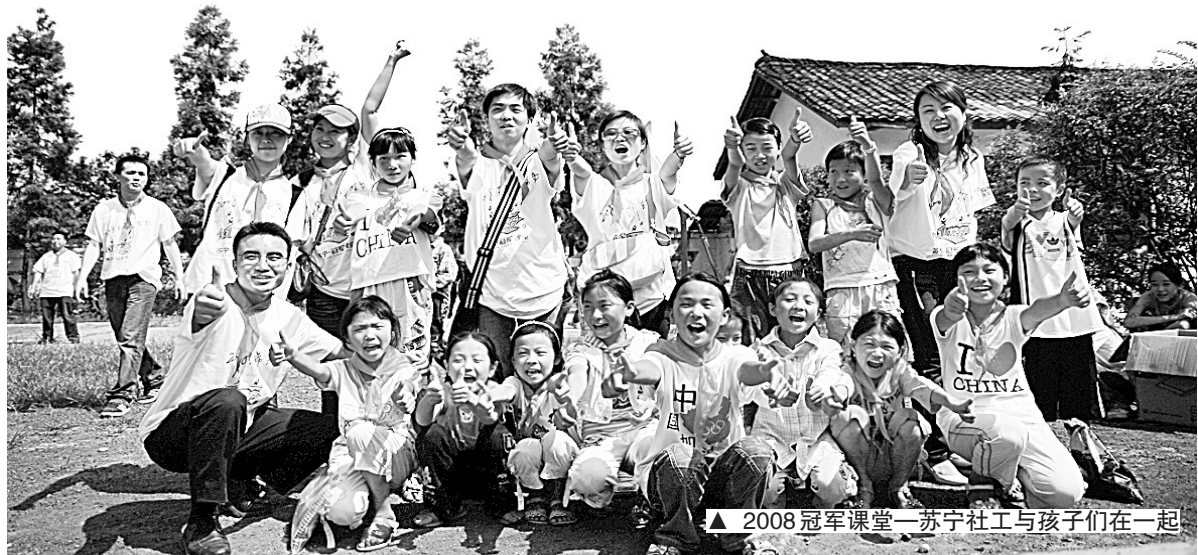
▲2008冠军课堂——苏宁社工与孩子们在一起