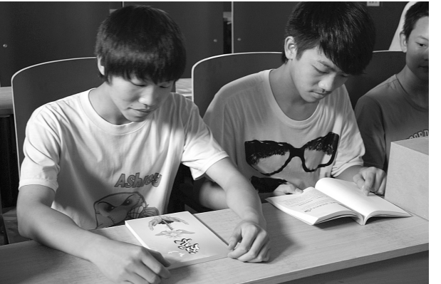
青少年认真地阅读《成长》

“我们计划在2011年达到2万人次的听讲人数目，现在已经达到了5541人。我们希望能真正地为青少年做一些事情，让他们快乐健康的成长。”