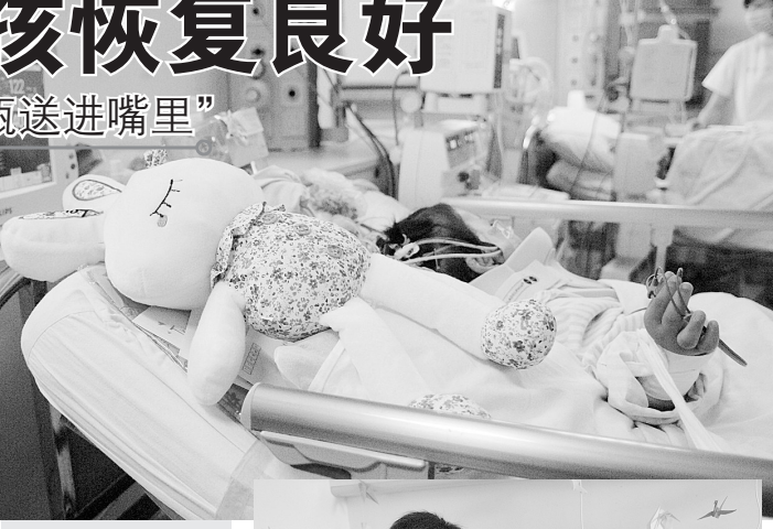
7月11日，妞妞躺在重症监护室内，床头摆放着爱心人士送来的娃娃和玩具。