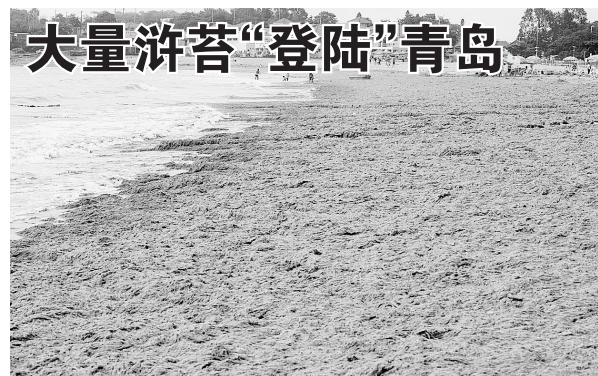
近日，浒苔大面积“登陆”青岛，给沿海养殖和旅游业带来不利影响。图为7月11日，青岛第三海水浴场沙滩上堆积着一层厚厚的浒苔。

10日晚，深圳地铁4号线清湖站的上行扶梯运行至1/3处后，突然停顿后逆行，造成4人受伤。值得注意的是，此次发生事故的扶梯并非奥的斯牌的。此前的7月5日，北京地铁4号线发生电梯事故，致1死30伤；7月7日，上海一部电梯突然从4楼如自由落体般“直坠”底楼。 均据新华社电