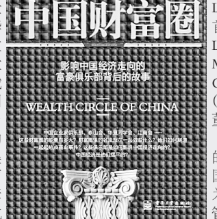
影响中国经济走向的富豪圈背后的故事 WEALTH CIRCLE OF CHINA

他们的学费非常昂贵，中欧商学院35万元左右，而长江商学院55万元左右。不过，这对顶尖的企业家而言，也是一笔很值得的花费。