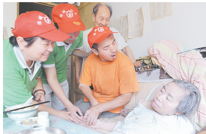
在母子俩的感召下, 越来越多的志愿者加入这个爱心队伍。