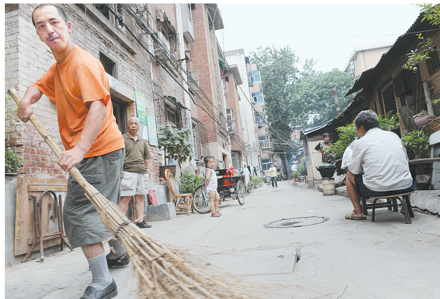
儿子每天坚持为社区打扫卫生。