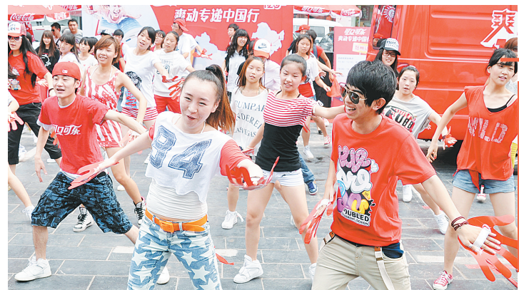
可口可乐爽动夏日125招郑州站活动昨天下午在郑州百盛广场举行。图为青春靓丽的“快闪族”表演舞蹈。

7月初,惠济一中李景玉同学和田径国少队队员一起,踏上了出征2011年法国世界少年田径锦标赛的征程。李景玉是惠济区一中体育训练基地的一名运动员,今年3月在四川成都举行的世界少年田径锦标赛选拔赛中脱颖而出,在女子三级跳远项目的比赛中获得第一名,被国家队选拔参加2011年世界少年田径锦标赛。比赛中李景玉发挥出色,三次有效成绩都在13米29以上,第四跳李景玉跳出了13米57的个人最佳成绩,为中国队夺得一枚银牌。