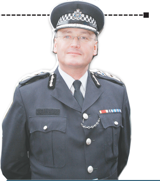
这是保罗·斯蒂芬森的资料照片。

布鲁克斯15日宣布辞去国际新闻公司首席执行官职务。由于在担任《世界新闻报》主编期间,该报记者窃听受害女孩道勒的手机语音留言,她近来一直是各界批评的焦点。 现年43岁的布鲁克斯曾是英国新闻界迅速上升的一颗明星,深得默多克的信赖。她2000年开始担任《世界新闻报》主编,2003年成为《太阳报》的首位女主编。2009年,布鲁克斯被擢升为国际新闻公司首席执行官。