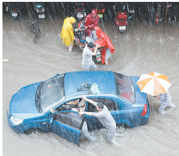
18日,南京市民冒雨转移被淹的车辆。

据新华社南京7月18日电 18日午后,南京城遭遇短时大暴雨,主城区多个地方两小时内降雨量超过100毫米,部分城区出现内涝。暴雨造成南京禄口机场午后至晚间航班大面积延误。