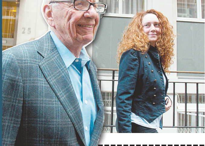
这是2011年7月10日在英国伦敦拍摄的丽贝卡·布鲁克斯(右)和默多克的资料照片。

英国天空电视台17日报道,英国警方因窃听案逮捕新闻集团下属新闻国际公司前首席执行官丽贝卡·布鲁克斯。 伦敦警察局局长保罗·斯蒂芬森17日宣布辞职,因为外界指责他与窃听丑闻有关的《世界新闻报》关系暧昧。 新闻集团总裁鲁珀特·默多克连续两天在多家报纸刊登道歉公告,誓言改正过错,协助警方调查。