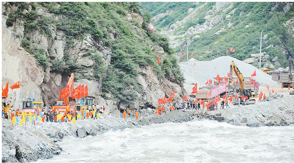
四川路桥的抢险人员在修补罗圈湾损毁路基(7月14日摄)。

据新华社成都7月18日电 18日13时,被泥石流冲毁中断了16天之久的汶川生命线都汶公路彻底贯通,全面通车。 记者当日从汶川县抢险应急指挥部了解到,施工人员冒着泥石流和山石垮塌的危险经过十多天的艰苦努力,终于将多处被泥石流冲毁的都汶公路抢通修复,并达到不限车辆、双向通车的标准。