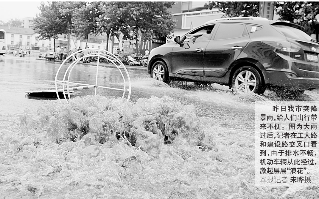
昨日我市突降暴雨,给人们出行带来不便。图为大雨过后,记者在工人路和建设路交叉处看到,由于排水不畅,机动车辆从此经过,激起层层“浪花”。

气象预报显示,周四夜里到周五,多云间阴天,有雷阵雨,温度24℃至32℃之间。周六和周日为雷阵雨转多云,温度25℃至33℃。