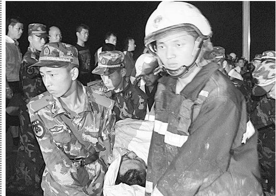
武警官兵和消防人员在事故现场抢救伤员。

事故发生后,消防战士、医护人员、交通警察、铁路工程人员、通信工程人员、刚刚逃生的乘客,在桥下乘凉的居民,在温州旅游的游客,出租车司机,外国游客……成千上万素不相识的人从四面八方汇拢来,通宵达旦不知疲倦的付出只有一个目的:生命,为了营救最宝贵的生命!