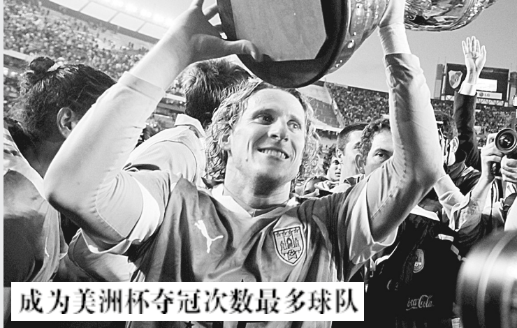
成为美洲杯夺冠次数最多球队

新华社布宜诺斯艾利斯7月24日专电 在24日进行的第43届美洲杯足球赛决赛中,乌拉圭队凭借两名前锋苏亚雷斯和弗兰的出色表现以3:0战胜巴拉圭队,夺得冠军。这是乌拉圭队第15次夺取美洲杯冠军,成为该项赛事夺冠次数最多的球队。