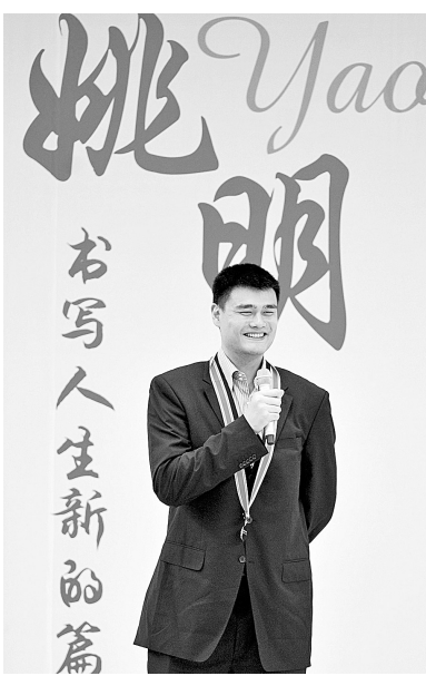
7月25日,“姚明退役仪式暨表彰典礼”在北京举行。姚明被授予中国奥林匹克金质奖章和体育运动荣誉奖章,中国篮球杰出贡献奖,中国男篮终身荣誉队员。

另外,在女子水球1/4决赛中,中国队以9:7击败加拿大队,第一次闯入世锦赛四强,半决赛中国队将与俄罗斯队交锋。