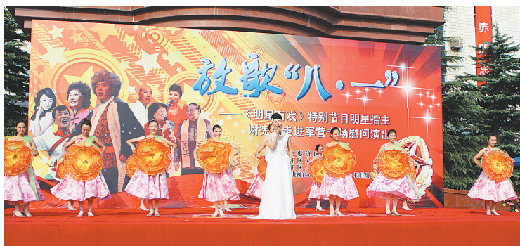
“八一”建军节即将到来,昨日,惠济区联合河南电视台9频道举办了驻区部队慰问和军民联谊活动,豫剧表演艺术家虎美玲、徐俊霞,《梨园春》栏目组主创谢宪莹及来自河南电视台少儿艺术团的小朋友,为驻惠济区部队官兵等数百人演出了歌曲、豫剧、舞蹈等丰富多彩的节目。

对此,不少网民希望有关部门认真反省,下决心彻底整治社团评奖乱象,还“共和国脊梁”真正的内涵。