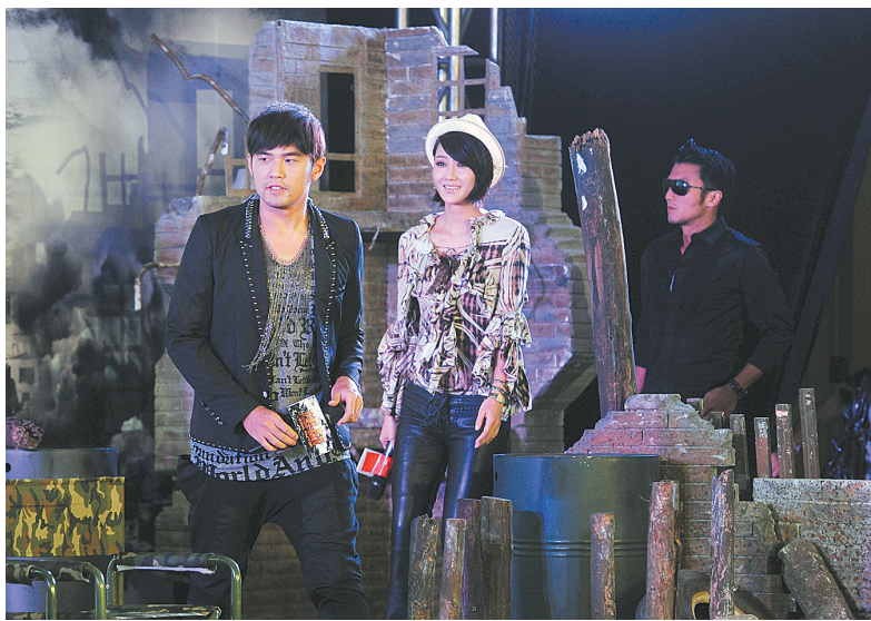
7月25日,周杰伦、林鹏、谢霆锋(左起)出席电影《逆战》发布会

谢霆锋和周杰伦在片中分别饰演哥哥万阳和弟弟万飞,造型颠覆。谢霆锋的半臂文身及一头挑染金发十分抢眼,周杰伦则蓄留胡须,增添了一份成熟男人的魅力和自信。两人都表示片中动作戏份是从影以来的最大挑战。周杰伦透露说:“从来没拍过这么辛苦戏,之后估计也不会再拍了。不过看过拍成的电影画面觉得一切都值了。”谢霆锋则表示动作戏之惊险逼近他的