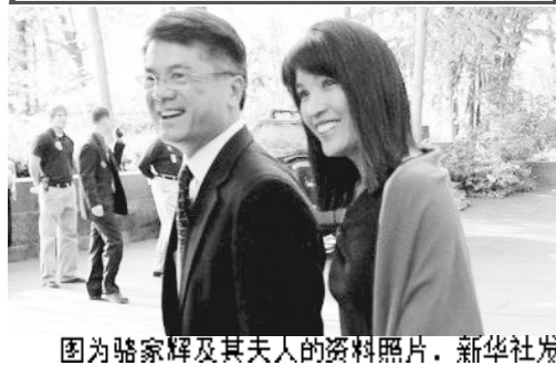
图为骆家辉及其夫人的资料照片。

骆家辉 (Gary Locke) ■ 1950年1月21日出生在美国华盛顿州西雅图 ■ 祖籍广东台山，祖父一代移民美国 ■ 讲英语和台山方言 教育背景 1972年获耶鲁大学政治学学士学位 1975年获波士顿大学法学学位 职业经历 1976年至1980年 在华盛顿州金县任副检察官 1982年至1993年 任华盛顿州众议员 1996年至2004年 作为民主党人任华盛顿州州长，是美国历史上第一位华裔州长 2009年5月1日 任美国商务部长 2011年3月9日 被美国总统奥巴马提名为驻中国大使 2011年7月27日 提名获美国参议院通过，骆家辉将成为美国历史上首位华裔驻华大使