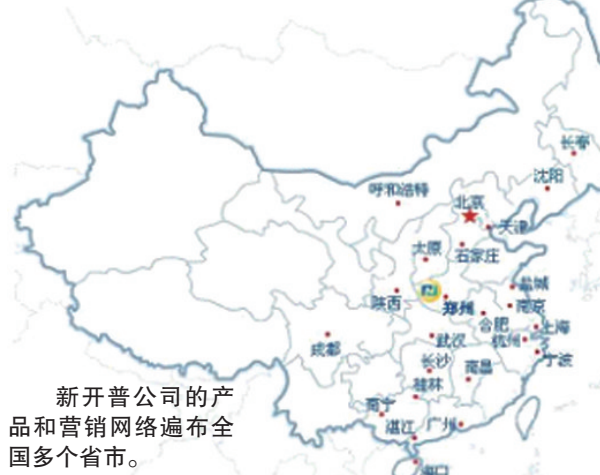
新开普公司的产品和营销网络遍布全国多个省市。

新开普是国内智能一卡通行业中为数不多的几家综合竞争力强、能够提供全面解决方案、产品应用遍及学校、