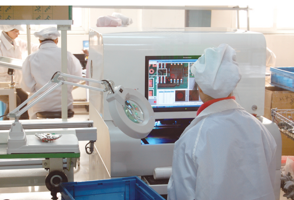
新开普现代化的标准生产车间