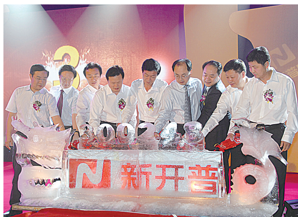
答谢酒会上,来自河南省有关厅局、郑州市及高新区的领导与公司负责人共同浇注“新开普”冰雕。