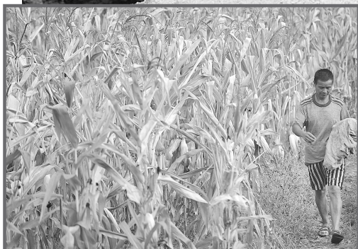
8月1日,贵州干旱重灾区黔东南州三穗县桐林镇棒相村一村民从已绝收的玉米地旁经过。