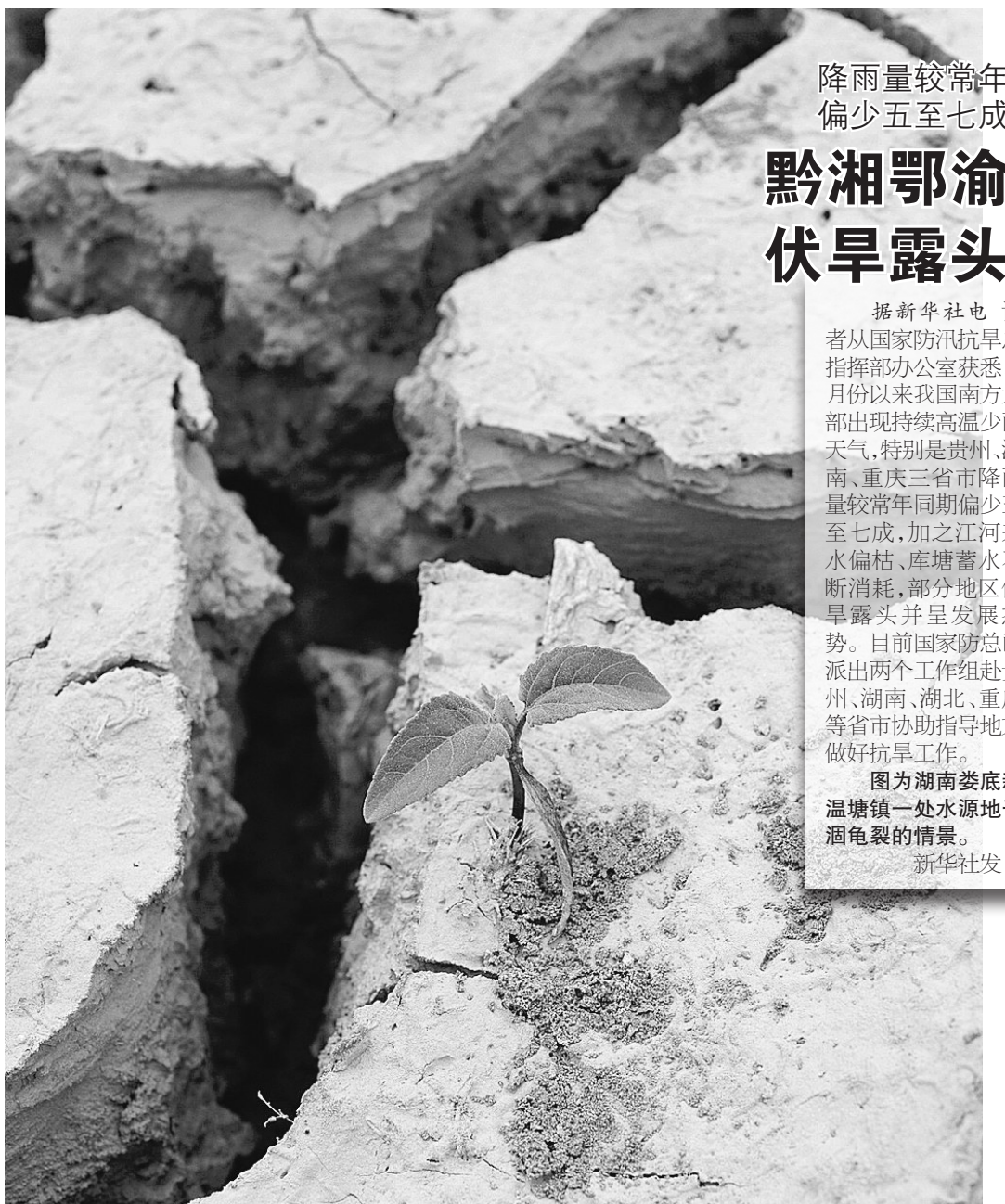
降雨量较常年偏少五至七成

对“捐款时间早于玉树地震”的疑问,中国红十字会总会说,平台公布的是自2010年1月11日以来向中国红十字会总会捐赠信息,公众不仅可以查询青海玉树地震的捐赠信息和援助项目信息,还可以查询2010年1月11日以来中国红十字会总会捐款账号的捐款到账信息,如为南方旱灾、舟曲泥石流、2010年水灾、云南盈江地震、日本地震的捐款等。对于较多同名同姓的捐赠者,今后总会也会进一步改进和完善。