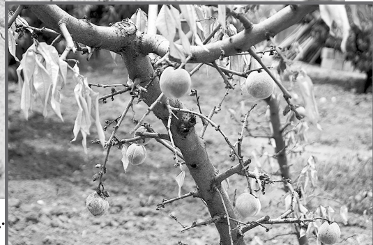
这是7月31日在贵州省贵阳市南明区干井村拍摄的受旱的桃树。