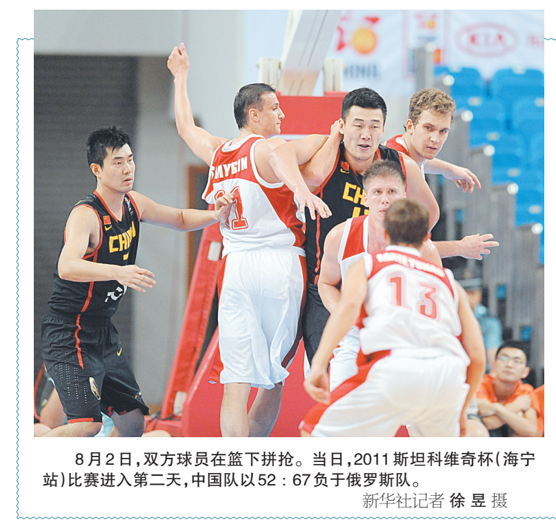
8月2日,双方球员在篮下拼抢。当日,2011斯坦科维奇杯(海宁站)比赛进入第二天,中国队以52:67负于俄罗斯队。

据了解,早在2007年,我市有关部门就曾出台计划,市属学校力争2009年全部开放运动设施。但是因为潜在的校园安全问题、场地设施的维护费用等多种原因,这种开放不了了之。 此次教育部门再次推出试点工作,记者随机调查的市民中,不少人赞成,也有不少人担心会再次失败,而不少学生家长则持反对意见。 “几年前就试点过一次了,但是并不成功。我想最根本的原因就是学校和家长担心出问题,如果允许社会人员进出校园,一旦出了校园安全事故,谁来负责?开放场地该不该收费?场馆维护费用很高,这笔钱谁来出?塑胶场地、足球场等场地,损坏了怎么赔偿?”市民徐先生认为,这些问题如果不能解决,试点就很难顺利开展。也有市民表示,去一趟学校场馆要预约、登记,开放时间也就两三个小时,实在麻烦。家长王女士还担心,进入校园的社会人员身份复杂,“带坏”孩子的可能性不小。 针对种种疑问,市教育局表示,试点工作开始前,我市教育、体育、民政、公安、物价、财政等多部门将加强沟通与协调,制订出《郑州市中小学校体育设施向社会开放管理办法》,具体指导开放工作,相信能给此次试点工作“保驾护航”。 本报记者 左丽慧