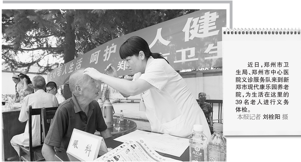
近日,郑州市卫生局、郑州市中心医院义诊服务队来到新郑市现代康乐养老院,为生活在这里的39名老人进行义务体检。

为使检测速度更快、结果更准、项目更全,该所积极开展药品快速检测技术应用,为基层一线基本药物监管提供技术支撑。2011年申报的“中成药中非法添加化学药品的快速检测研究”项目获新郑市科学技术进步奖。在2010年11月郑州市局组织的稽查药监系统技术大比武活动中,荣获郑州市2010年度药品、医疗器械抽验检验工作先进单位。