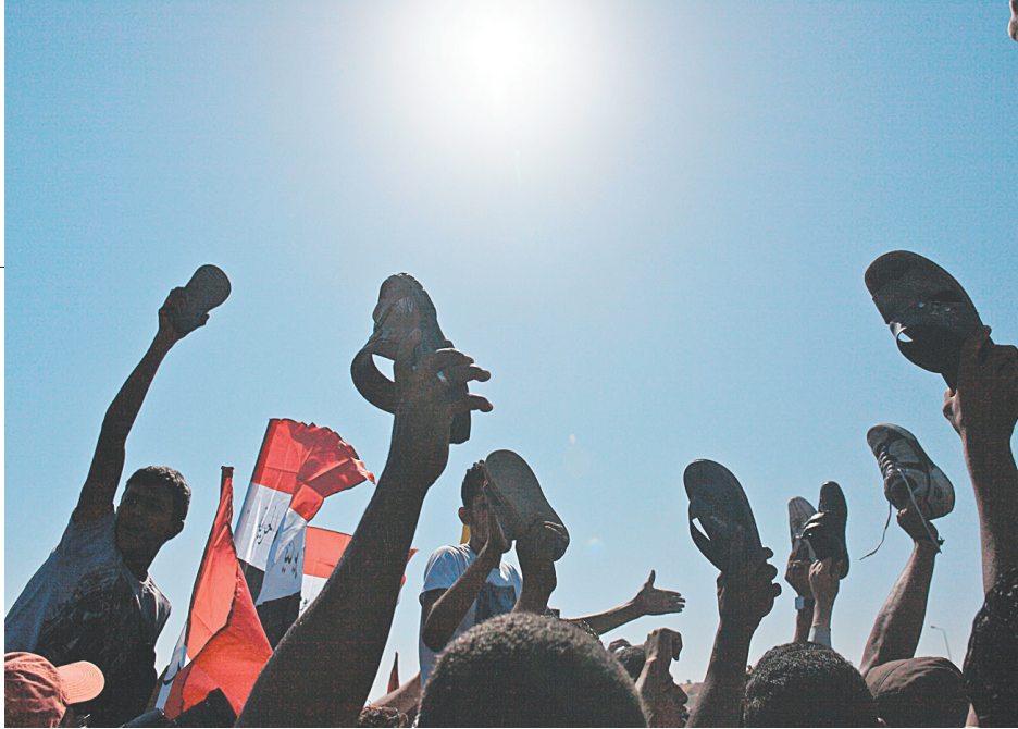
8月3日,在埃及首都开罗警察学院外,前总统穆巴拉克的反对者举着鞋子参加集会。