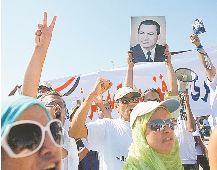
8月3日,埃及前总统穆巴拉克的支持者在开罗警察学院外集会。新华社发

当日,连接约翰内斯堡和比勒陀利亚的南非第一条城际高速铁路“豪登高速铁路”正式投入运营。豪登铁路全长80公里,列车最高时速为160公里,全程约需42分钟。新华社发