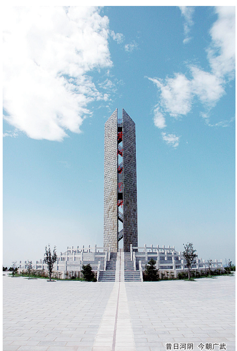
昔日河阴 今朝广武

广武,古名河阴,置县已有1300年历史,后改制为乡、镇,地处黄河中下游分界线,是世界上1200万郑氏族裔谒祖朝拜的圣地。北临黄河,南望嵩岳,东接黄河游览区,西连虎牢古战场,总面积155平方公里,下辖42个行政村,人口9.4万,是“国家卫生镇”、“郑州市生态镇”,被誉为“中州名镇”。