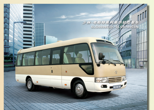
7米考斯特造型客车