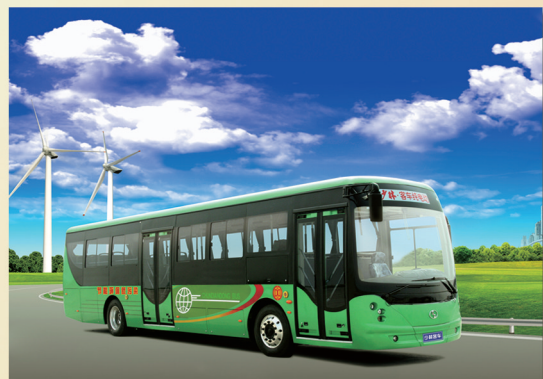
12米纯电动城市客车