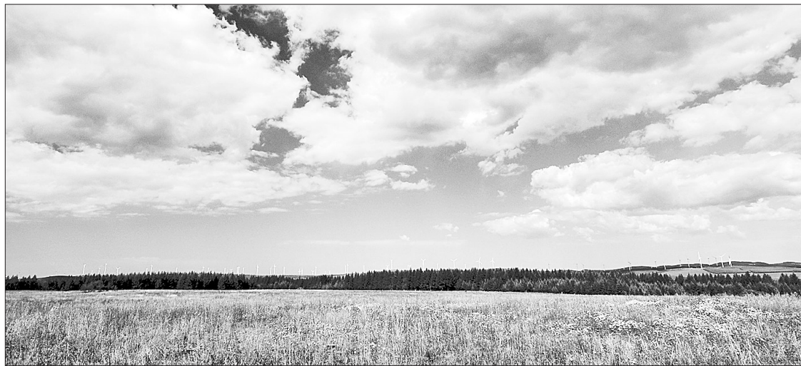
蓝天白云下

作者剥去了上访群众种种上访事由的外衣，再现了上访者和接访者各自的立场和诉求，以及由此而产生的种种尴尬、矛盾和无奈。作者笔下所展现的，是上访者无助的眼睛和接访者悲悯的情怀，以及信访关系各方的众生相。读完此书，既让人对信访者的遭遇给予了极大同情和怜悯，又让人对接访干部的工作多了几分理解和宽容。 作者工作的经历，为本书提供了关于上访接访的丰富的原始生活素材，既有上访者闹访、缠访的细节，也有开办信访培训班等接访者的伎俩。作者对这些信手拈来的素材进行了细致而妥帖的处理，使之更好地为小说的主题服务，通过还原上访者和接访者的内心世界，在二者之间架起了一座心意沟通的桥梁。全书语言朴素流畅，故事真实曲折，人物生动鲜活，情感饱满真挚。读来既令人唏嘘感叹，又能引发诸多思考，是一部关注现实生活、关注基层民生的小说佳作。