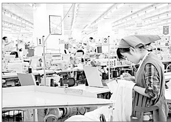
在南方的一些企业目前只能是“生产在经营”。