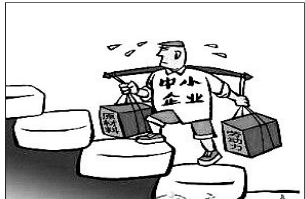
部分中小企业由于原材料、劳动力等价格上涨,经营困难。