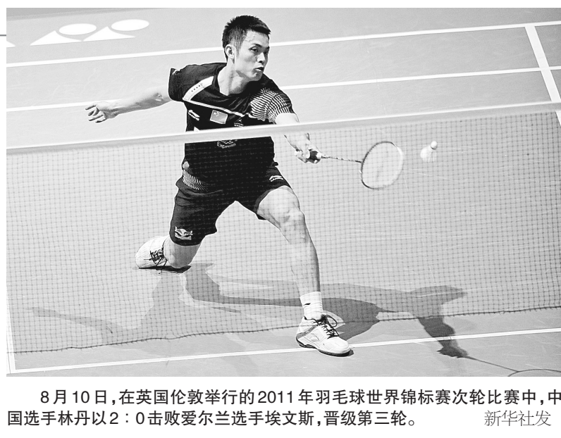
8月10日,在英国伦敦举行的2011年羽毛球世界锦标赛次轮比赛中,中国选手林丹以2:0击败爱尔兰选手埃文斯,晋级第三轮。