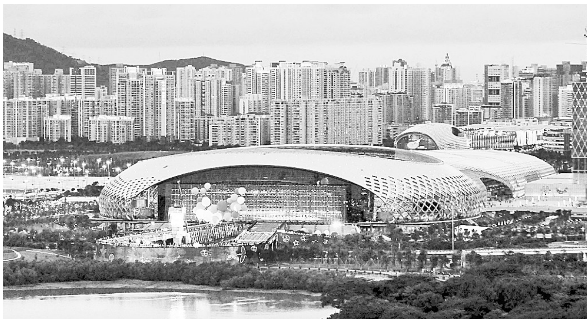
坐落在深圳湾畔的“春茧”静等开幕式的到来。

以往的大型体育赛事的开幕式,运动员入场仪式后要“退场”,然后进行文艺演出。而大运会的开幕式将让运动员成为真正的“主角”,运动员入场后不退场,而是坐在一场中观看开幕式并与演员和观众一起互动。“运动员入场”环节还将一改通常