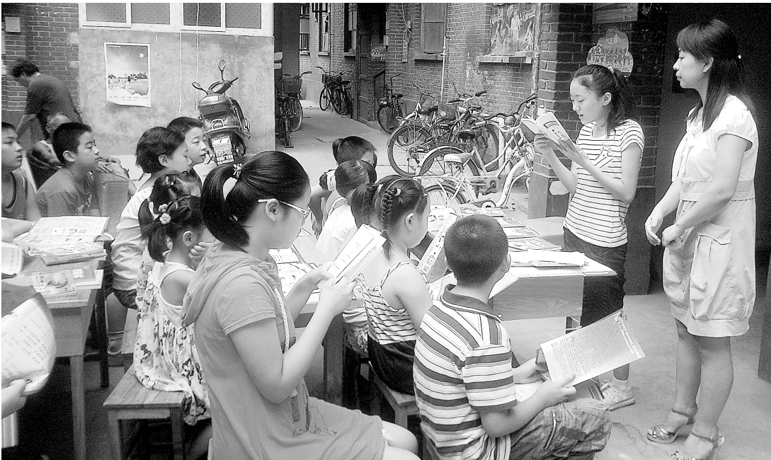
日前,大学路桃源社区组织辖区青少年开展了“我是小小读书郎”读书会活动,社区工作人员和孩子们一起诵读《郑州市文明礼仪手册》,并让孩子们相互介绍学习体会,把文明礼仪播撒在孩子们心田。

十几分钟后,抢险队伍跑步赶到现场,防汛应急物资也运抵现场。半个小时后,塌方部位被夯实修补一新。