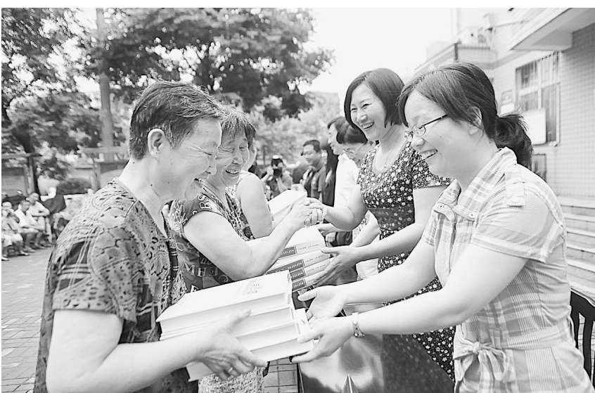
昨天上午,管城区科技局将300多册科技图书和价值3万多元的高科技新型节能路灯送到南关街办事处惠工街社区。