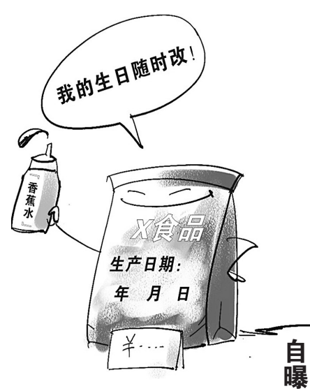
新华社记者 冯印澄作

“对于涂改食品保质期问题，从大企业到小商贩，很多人心知肚明。”北京一位知名食品包装机械制造商透露，目前，比较有效的反制措施，是使用激光打码机，它把生产日期等信息用激光“烧”在包装上。 但对于“激光机”，食品业界不少厂家敬而远之。主要原因是成本太高，价格是使用油墨设备的2倍左右。同时生产效率低于“油墨机”，会影响企业产能。 为此，食品行业一些大公司对于涂改日期采取“内控风险”态度：在生产日期等喷码信息中加入特殊代码，一个代码只对应一个批次产品。这样，产品日期遭涂改而出现质量纠纷时，企业就会举证寻求免责。但消费者却成为最大的受害者。