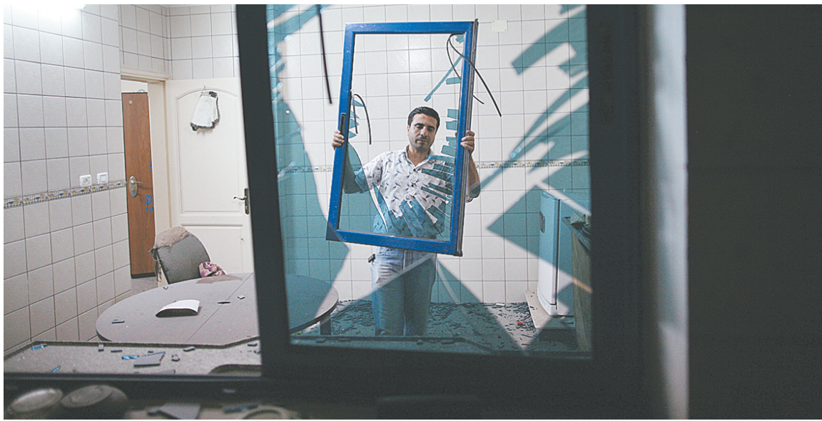
位于哈马斯安全据点附近的新华社办公室受到波及,所幸未造成人员伤亡。

据新华社电 以色列战机18日夜至19日上午对加沙地带多处地区发动空袭,造成至少6人死亡,17人受伤。以方表示,此次空袭是对以南部18日遭袭事件的回应,该事件造成至少8名以色列人死亡、数十人受伤。以军当天还向巴勒斯坦伊斯兰