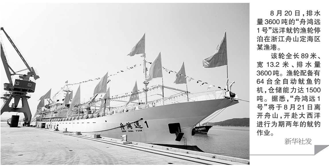
8月20日，排水量3600吨的“舟鸿远1号”远洋鱿钓渔轮停泊在浙江舟山定海区某渔港。

本报讯（记者 王恩俊 通讯员 张玉）近日，省科学技术学会、省农科院、省科技厅联合下发公布2011年度河南省科技兴农和富民先进单位名单，市畜牧技术推广站荣获“2011年度河南省十大科技富民先进单位”。市畜牧技术推广站多举措推广先进技术，科技对畜牧业的贡献率达到50%以上，促进了畜牧业生产的健康可持续发展。