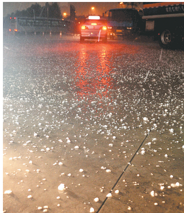
8月21日晚,沈阳街头的“冰雹”。

据新华社沈阳8月21日电 21日18时许,沈阳市南部地区出现了罕见的冰雹雷雨天气过程。鸽子蛋大小的冰雹雨点般倾盆而下,在地面上竟然一度形成了冰面奇观。