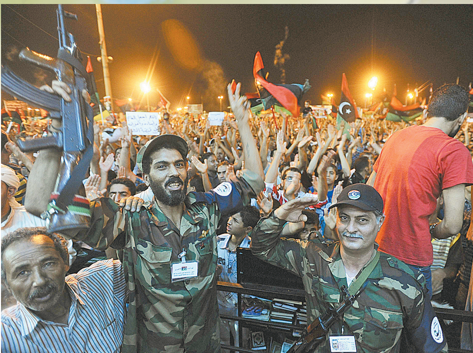
8月21日凌晨,反对派支持者参加在利比亚班加西举行的游行集会。新华社发