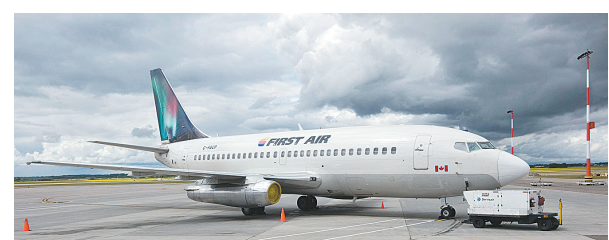
这张资料照片是2009年7月15日在加拿大埃德蒙顿拍摄的第一航空公司的波音737-200客机。

据新华社渥太华8月20日电 加拿大一架波音737客机20日在位于北极地区的雷索卢特湾附近坠毁,造成机上12人死亡,3人受伤。