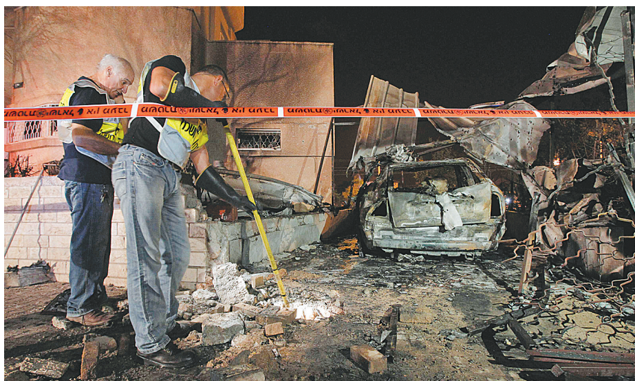
8月20日,在以色列南部城市贝尔谢巴,工作人员在遭袭民房中调查。

据新华社耶路撒冷8月20日电 以色列南部城市贝尔谢巴20日晚遭火箭弹袭击,1人死亡。