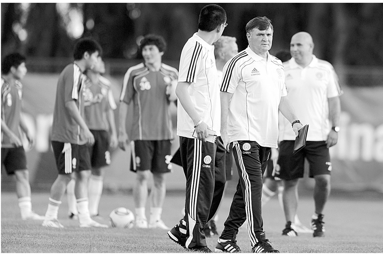
8月22日,中国男足国家队主教练卡马乔(右前)在训练中。当日,中国国家男子足球队新一轮集训在昆明展开,卡马乔也迎来他在国家队的第一期集训。国足此次将在昆明备战9月2日与新加坡队的世界杯预选赛。