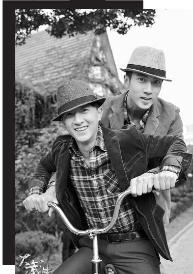
吴尊、韩庚主演《大武生》