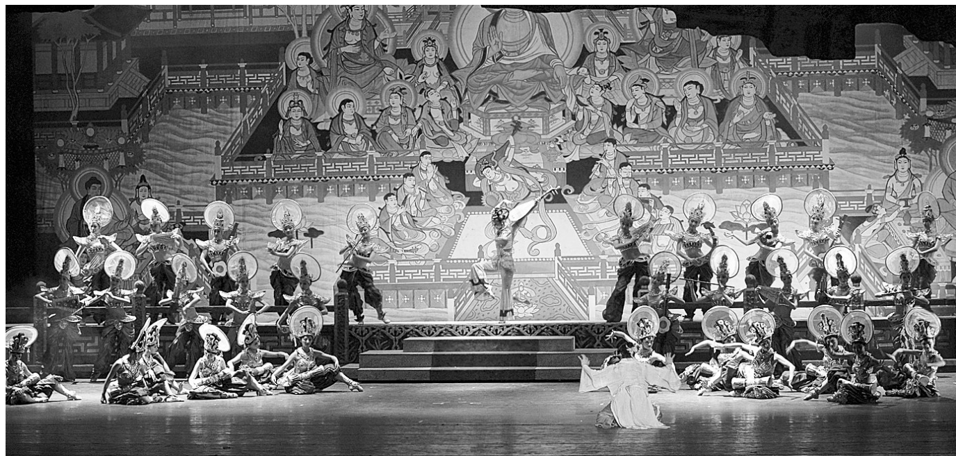
舞剧《丝路花雨》剧照

本报讯(记者 秦华)记者昨日获悉,有着“活的敦煌壁画、美的艺术享受”美誉的中国经典舞剧《丝路花雨》,将于9月6日、7日在河南艺术中心华丽上演。《丝路花雨》自从1979年公演以来,征服了世界各地的观众,此次在绿城上演的是经过全面创新修改复排的新版。新版有何亮点呢?记者昨日电话采访了甘肃省歌舞剧院副院长张稷。