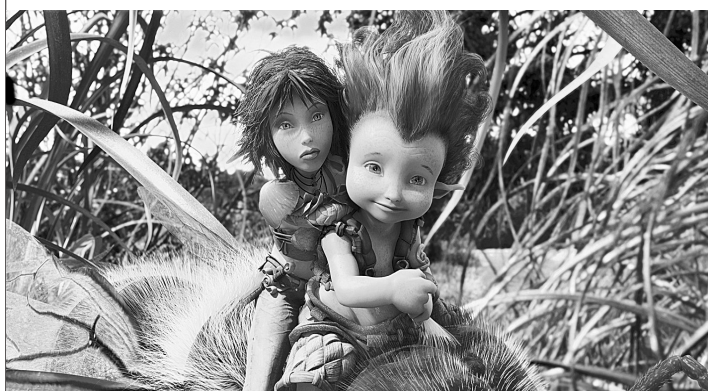
《亚瑟3:终极对决》剧照