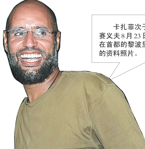
卡扎菲次子赛义夫8月23日在首都的黎波里的资料照片。

俄罗斯外交部1日发表声明宣布,俄罗斯承认利比亚“全国过渡委员会”为现在在利比亚行使权力的政权。