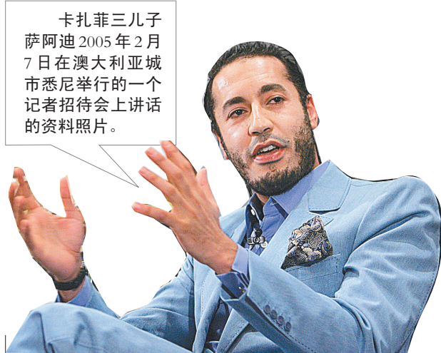
卡扎菲三儿子萨阿迪2005年2月7日在澳大利亚城市悉尼举行的一个记者招待会上讲话的资料照片。

据阿尔及利亚主要法文报纸《祖国报》8月31日网络版报道,利比亚领导人卡扎菲与家人目前正在利比亚、突尼斯和阿尔及利亚3国边界附近的古达米斯镇,并试图进入阿尔及利亚避难,但阿尔及利亚政府还没有同意。