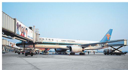
繁忙的航空港物流

推动龙子湖高校园区入驻高校软硬件设施、高层次人才公寓、培训中心等建设,扩大入住师生规模,规划建设新就业人员培训园区,强化就业培训和创业;重点推进河南农业大学、华北水利水电学院、河南警察学院、河南财经政法大学、河南中医学院等高校建设项目。启动龙子湖湖心岛建设,尽快建成学术交流中心、图文信息中心、商场、酒店、体育馆等公共服务设施,实现资源共享;引进一批科研院所,规划建设科技孵化园,发挥高校科研、人才优势,促进科技成果就地快速转化。完善商务休闲与产业服务功能,加快建设创新产业基地,打造高品质生活居住区与创意产业区。到2020年,建成高等院校15所,在校生规模达到24万人。