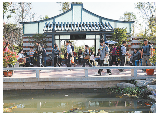
绿博园吸引八方游客