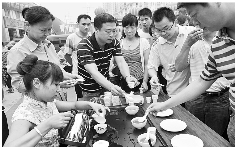
昨日,一场以“普洱茶香·溢满中原”为主题的普洱茶河南品鉴展示会在郑州国香茶城落幕。为期三天的展示会吸引了云南、郑州两地的许多知名茶企和茶商。展示会上还举办了河南茶产业流通领域发展论坛、普洱茶讲座等一系列精彩活动。 图为市民在普洱茶斗茶会上品尝香茶。

州慈善总会将就这些项目的开展情况向市民公示,同时征求市民意见,您觉得哪些项目应该开展,哪些人需要救助,都可以拨打电话68665308,向慈善总会提出建议。郑州慈善总会将综合市民意见,确定今年的慈善救助项目。