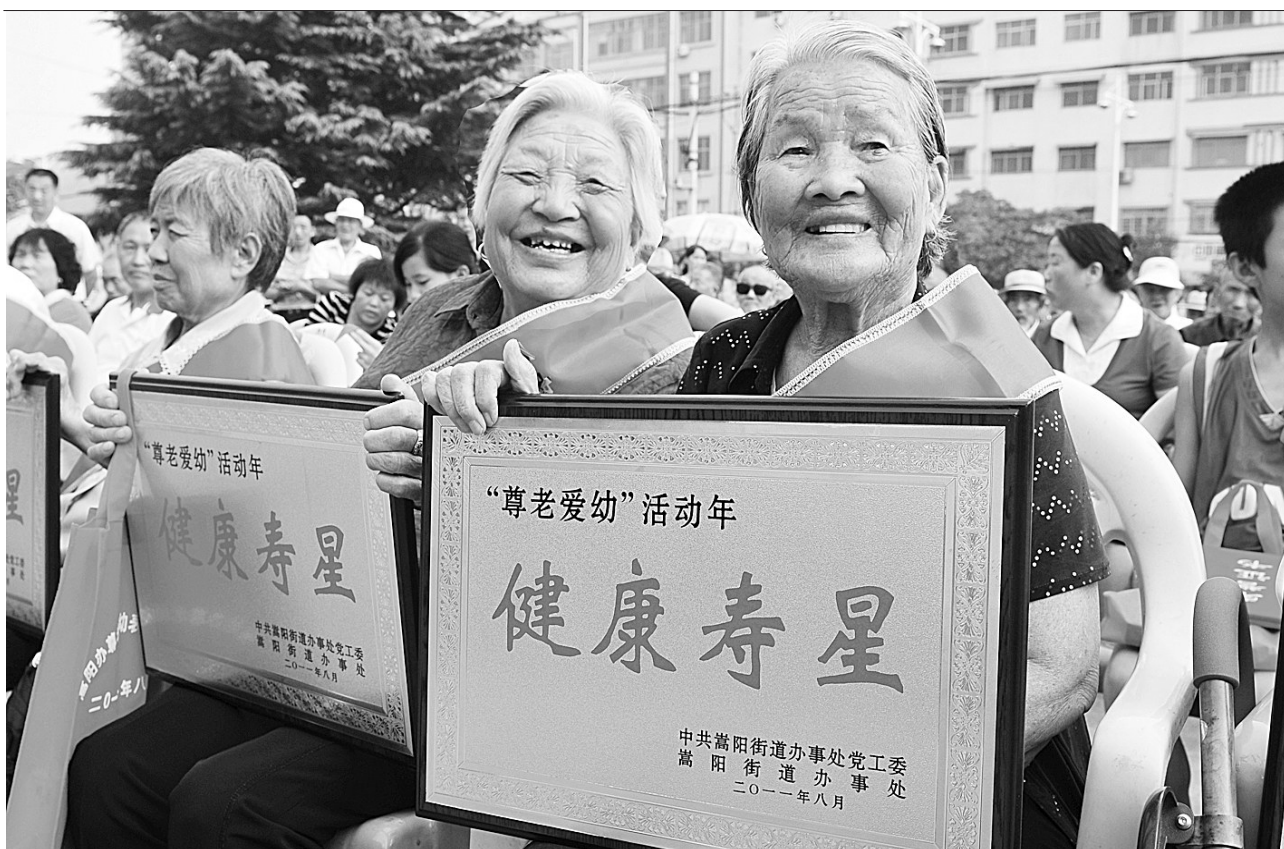
近日,登封嵩阳街道办事处在嵩阳公园举行尊老爱幼楷模表彰大会,11名健康寿星、10名敬老楷模、10名小孝星受到表彰。

“三评”确保群众满意。党员自评——采取个人总结和集中自评相结合的形式。结合公开承诺,每月自己总结一次,每季度集中召开一次自评座谈会,查找不足,改进工作。领导点评——上级党组织点评下级党组织,党组织点评党员,结合工作例会、学习交流等,每半年至少点评一次。群众测评。注重调查研究,问计于民,科学制定、发放群众测评表——在服务窗口,设立电子测评器和意见箱,开通网上测评电子邮箱。认真梳理群众意见,建立台账,抓紧整改,及时反馈,以实际行动提高群众满意度。