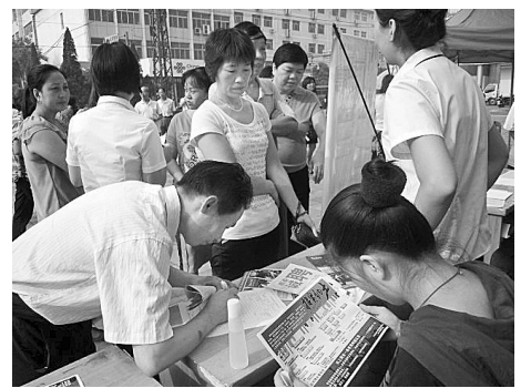
日前,由巩义市新华路街道组织的就业再就业现场招聘会在三新广场上举行。现场有盛威帝帝、华润万家等46家单位提供了物业管理、餐饮等32个工种,共600多个岗位,当天,151人与招聘单位初步达成了就业意向。

同时,该市相关部门还在搞好政策宣传的基础上,紧扣服务主题,以加强制度建设、队伍建设、基层平台建设入手,不断提升服务质量,实现了经办工作标准化、管理精细化、服务人性化和信息系统建设网络化。这一系列的举措,不仅让城乡居民对居民养老政策有了更深入的了解,还有效调动了城乡居民参保的热情。截至目前,新郑市累计参保居民达到15.6万人,其中60周岁以上老人累计参保7.1万人。