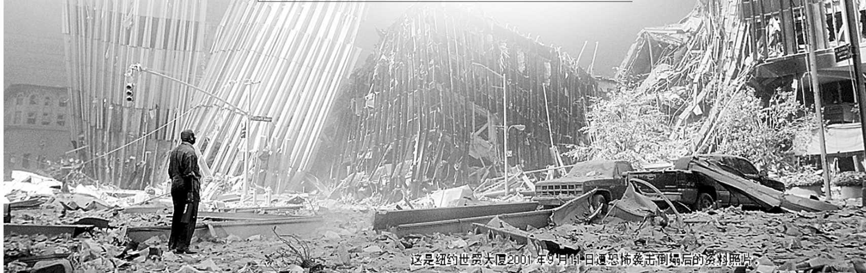
这是纽约世贸大厦2001年9月11日遭恐怖袭击倒塌后的资料照片。

治本——赢在制胜之道 ——重视消除恐怖主义发生发展的根源,标本兼治。 ——必须坚持联合国的主导地位。 ——对恐怖主义的界定需要达成一致认识。 历史经验与教训说明,单靠一个或几个国家,难以应对和彻底根除全球恐怖主义威胁。只有通过各国努力,建立一个更包容的世界,才有可能有效遏制恐怖主义。