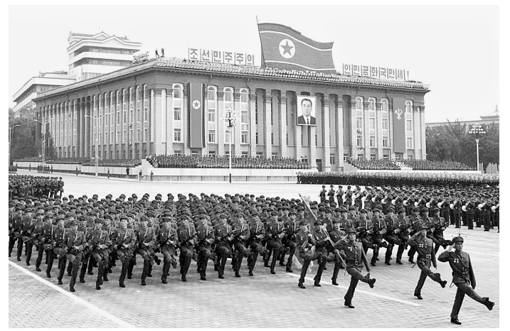
朝中社9月9日提供的照片显示,朝鲜当日在平壤金日成广场举行工农赤卫队阅兵式,庆祝建国63周年。