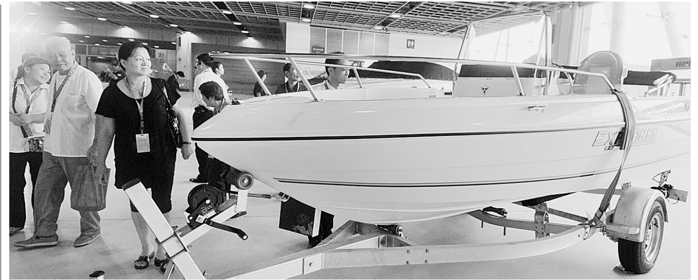
9月13日,2011中国国际租赁产业博览会在南京国际展览中心举行。本次博览会将持续至16日,展览面积达4.5万平方米。据介绍,博览会分高档豪华车辆区、高档办公家具区、奢侈品区、顶尖数码区等,展品既有高端商品迈巴赫、兰博基尼、宾利汽车等,也有健身器材、家具

上述项目之外的机动车业务请到车管所下属的城南服务站、城北服务站、城西服务站办理。