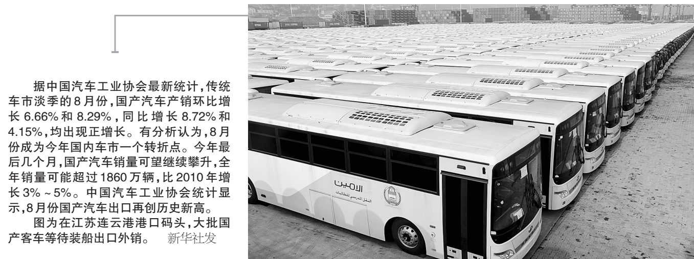
据中国汽车工业协会最新统计,传统车市淡季的8月份,国产汽车产销环比增长6.66%和8.29%,同比增长8.72%和4.15%,均出现正增长。有分析认为,8月份成为今年国内车市一个转折点。今年最后几个月,国产汽车销量可望继续攀升,全年销量可能超过1860万辆,比2010年增长3%~5%。中国汽车工业协会统计显示,8月份国产汽车出口再创历史新高。图为在江苏连云港港口码头,大批国产客车等待装船出口外销。新华社发