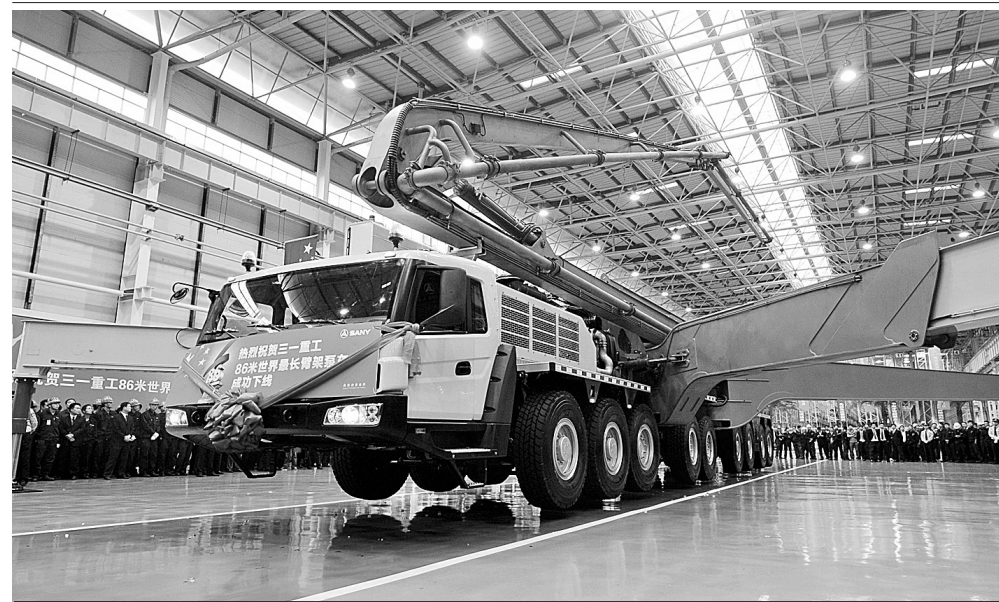
9月19日,由三一重工自主研发的世界最长86米臂架泵车在长沙成功下线,再次刷新其在2009年创造的72米世界最长臂架泵车的纪录。据介绍,这台86米泵车采用世界首创7节臂设计,施工范围较5节、6节臂更广泛灵活。同时为解决臂架高强度钢板形变和冲击韧性低的难题,三一还创新热处理工艺自主研发出1200MPa高强度钢板,形成了独有的竞争力。

作为今年以来内地市场最大规模的IPO项目,中国水电启动招股。这令本已紧张的市场资金再度承压。欧债危机再生变数,也在一定程度上对A股形成负面影响。在这一背景下,沪深股市缩量下行。