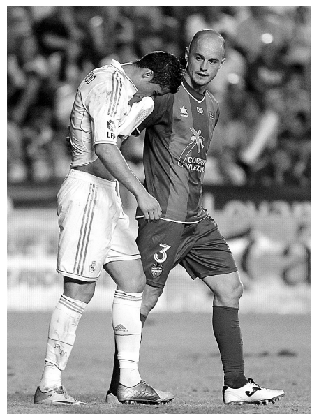
9月18日,皇马队球员克里斯蒂亚诺·罗纳尔多(左)与莱万特队球员纳诺在比赛中。当日,在西班牙足球甲级联赛第四轮比赛中,皇家马德里队客场以0:1不敌莱万特队。