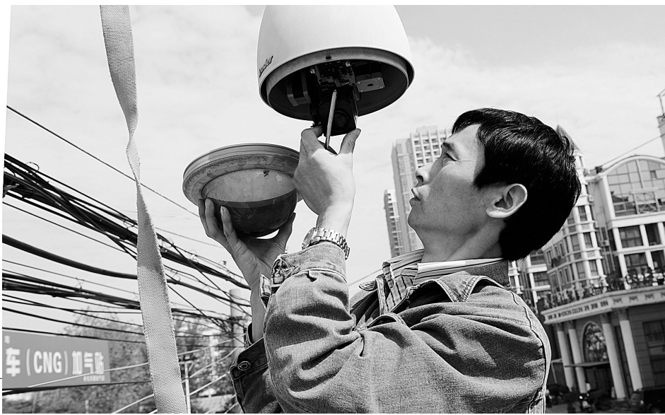
昨日,记者从中原区信息数字化服务中心了解到,为加强平安建设,该区对监控点损坏问题进行集中整治,全面“体检”,截至昨日,共维修更换编码器107个、摄像机145个,修复光纤连接器100对,预计本月底将全部完成修复整治工作。

准入和退出机制。我市将建立信息共享机制,市住房保障、民政、公安、社保、工商、税务、金融、住房公积金等相关部门对申请保障性住房家庭的户籍、婚姻状况、房产、收入、财产等情况进行联合核查并进行公示。经适房购房人又购买其他住房的,必须办理经适房退出手续,或者通过缴纳差价款取得完全产权。已购经适房上市交易后,原申请人不得再申请保障性住房。而对骗购经适房的,一经查实,由市住房保障部门责令退还所购房屋,并依法注销其房屋所有权登记,或补缴同期、同地段商品房差价款,购房人五年内不得再次申请购买经适房和其他保障性住房;对不补交差价款未取得完全产权而出租、出借和改变使用性质的行为,将严肃查处。