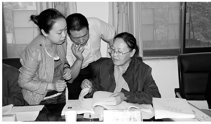
监事会成员在查看“账单”。

目前,已经为我市贫困重度肢体残疾人免费发放轮椅870辆,剩下的轮椅还将逐步发放。