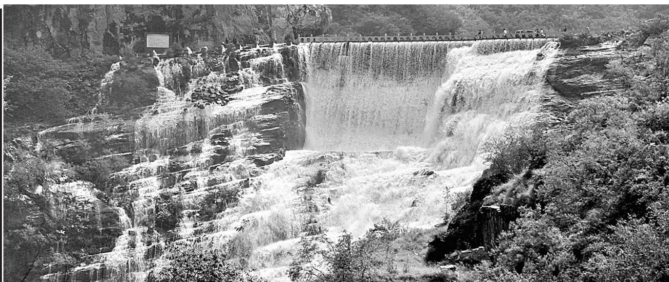
难得一见的瀑布美景。

据了解,中国科学发展评价体系主要从经济发展、社会进步、民生改善、环境友好和运行效率共五个方面对中小城市科学发展进行动态监测。目前,该体系经过不断完善,已成为中国中小城市及县域经济首套全面、系统、权威、可操作性强的科学发展指标体系,为全国中小城市交流发展经验,探讨县域经济发展搭起了一个良好平台。