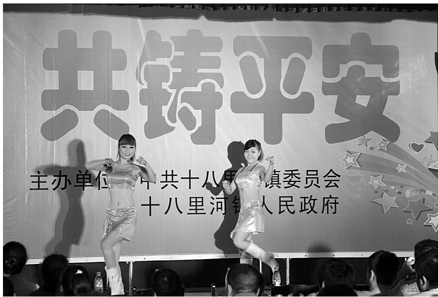
日前,十八里河镇举办了一场“共建平安家园”的演出,以歌曲、相声、豫剧等形式宣传安全知识,迎接国庆节。

在当天的活动中,沿街摆放的31个科普、法律展板,图文并茂,吸引了数千名农民群众前来观看、咨询。现场发放各类宣传资料13000份、健康药具376份,发布用工信息227条,为农民义诊139人。