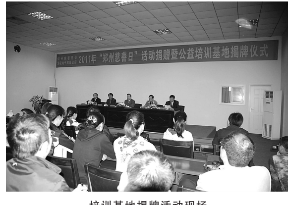
培训基地揭牌活动现场