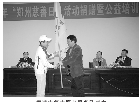
索凌电气志愿者服务队成立

据介绍,索凌电气有限公司成立于1999年,是河南省电气设备行业的支柱企业,国家级知识产权试点企业、高新技术企业。公司注册资金10500万