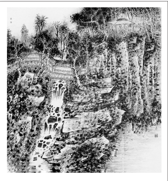
静听天籁(国画) 胡宝利