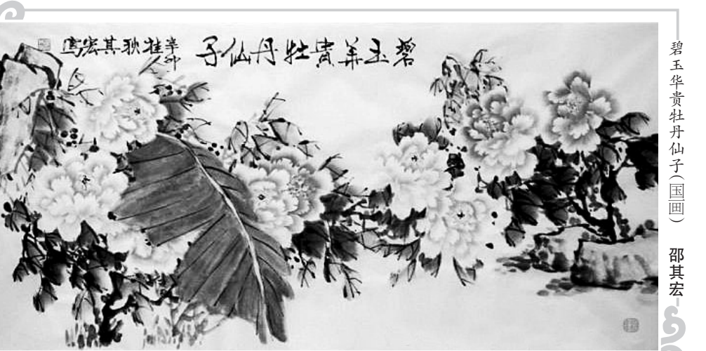
碧玉华贵牡丹仙子(国画) 邵其宏

都说是有量,酒之量,肚之量,心之量,何物来量呢?酒量,气度,胸襟,别有洞天,各有各的境界,不同的境界,人生自有迥然不同的风采。